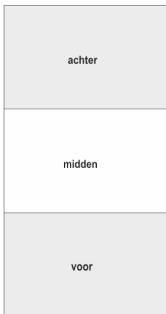
hele tuin in 3 delen

Het teelplan levert u in bij het bestuur en de Tuincommissie wordt hierover geïnformeerd. Zij zien toe op de naleving van de reglementen aangaande de aardappel teelt .