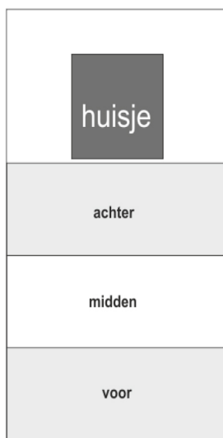
tuin in 3 delen vanaf voorkant van het huisje dus niet terras maar het huisje