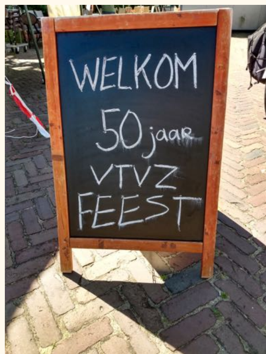
Borrel en onthulling nieuw verenigingsbord door de burgemeester.