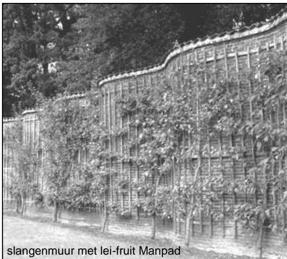
slangenmuur met lei-fruit Manpad

De stichting Fruittuinen Zuid Kennemerland, waar ik ook lid van ben, was ook uitgenodigd om daar met een kraam te staan (n.b. De stichting Fruittuinen ZK hebben in februari de snoeicursus bij ons op het complex verzorgd).