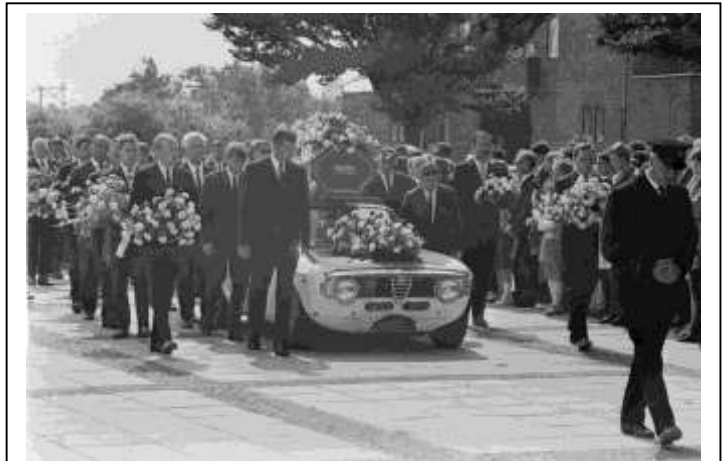
De begrafenis van Wim Loos juli 1967

Helaas overleed deze geweldige coureur en inspirator veel te vroeg. Op zijn eigen circuit reed hij, op ongelukkige wijze, zijn eind tegemoet.