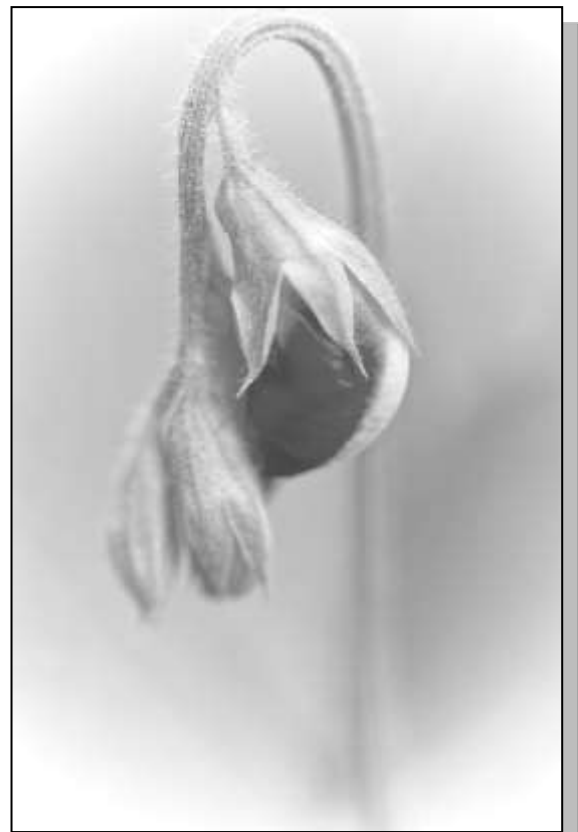
Foto's gemaakt door Jolanda Meier op haar tuin. Voor meer foto's van Jolanda kijk dan eens op onze site onder de link : Info van leden / Mijn Moestuin - Jolanda Meier